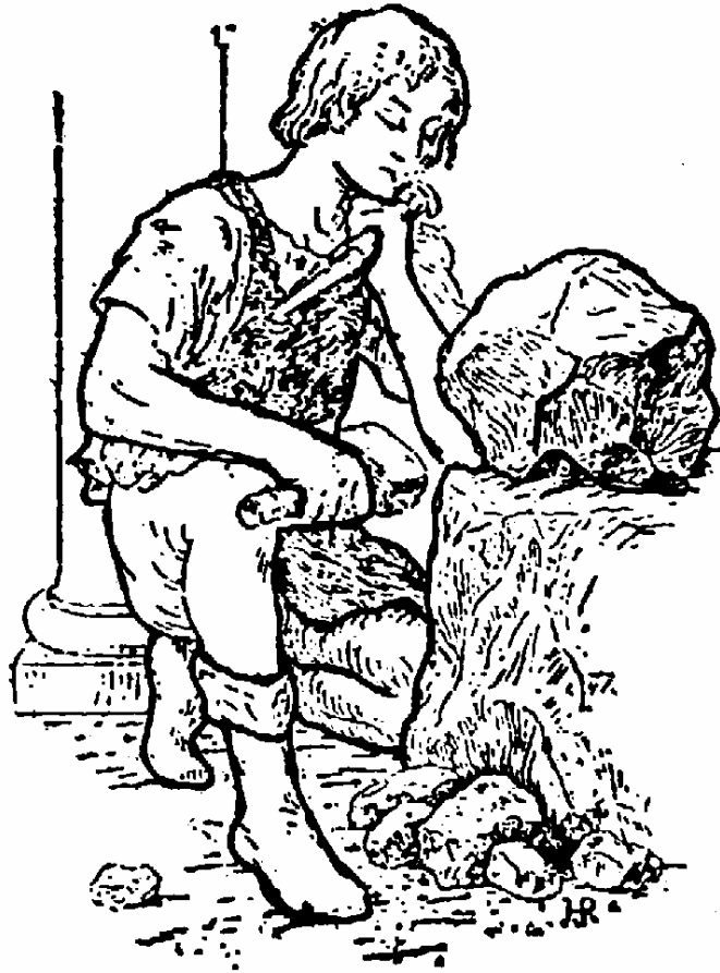
El aprendiz delante de la piedra bruta que debe Pulir con ayuda del Cinzel y el Martillo